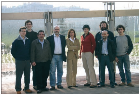
El inicio: Elecciones generales 2004. Candidatos al Congreso y Senado