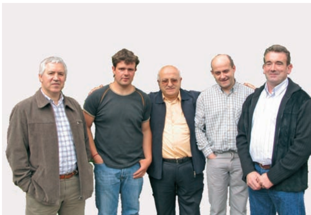
Los cinco primeros miembros de la candidatura de Arantza

Estudiaremos la posibilidad de implantar un servicio similar al conocido “Voy y vengo”, para atender las necesidades de desplazamiento de muchos jóvenes.