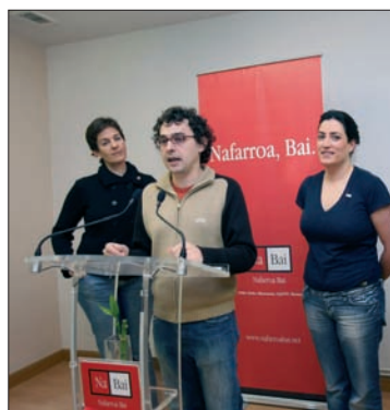
Candidatos de Iruña durante una rueda de prensa sobre las elecciones municipales del 27 M