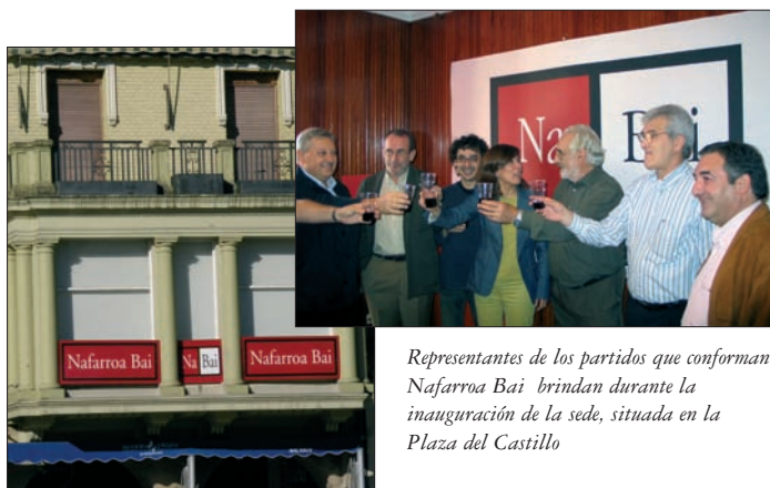
Representantes de los partidos que conforman Nafarroa Bai brindan durante la inauguración de la sede, situada en la Plaza del Castillo