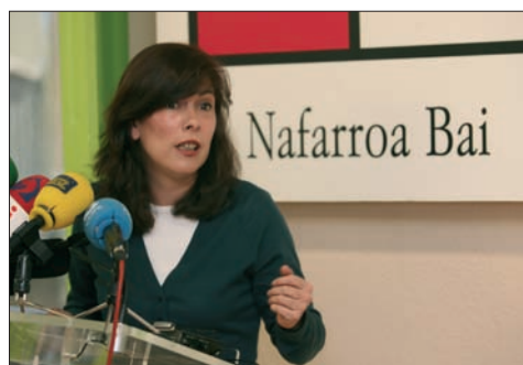
Uxue Barkos, diputada de Nafarroa Bai, en una comparecencia ante los medios de comunicación