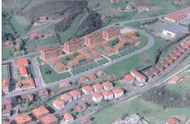
Recreación por ordenador del proyecto de viviendas previsto para Landazelaiak. Abajo, situación actual de los terrenos.

Asimismo, el local de 150 metros cuadrados existente dentro del edificio del antiguo asilo queda en propiedad del Ayuntamiento, que prevé acondicionarlo para charlas de formación y para atender necesidades que puedan surgir desde el Centro de Salud.