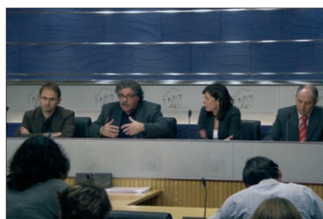
Uxue Barkos en la presentación de una iniciativa sobre Memoria Histórica en el Congreso