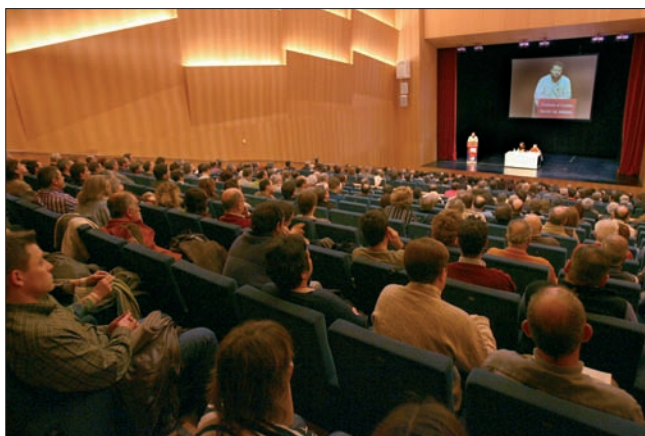
Dos imágenes captadas durante la II Asamblea General de Nafarroa Bai, celebrada en Baluarte en enero de 2007