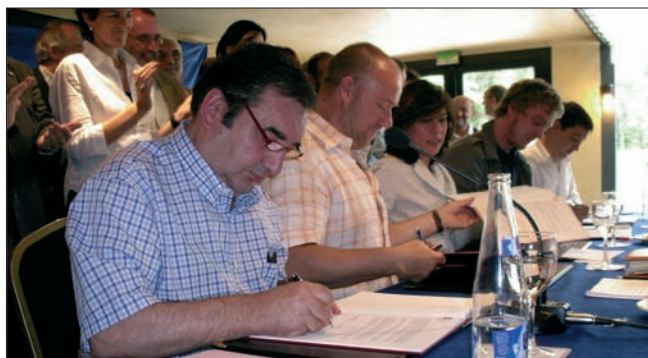
Junio 2006. Representantes de partidos e independientes firman los Acuerdos para concurrir a las elecciones municipales y forales