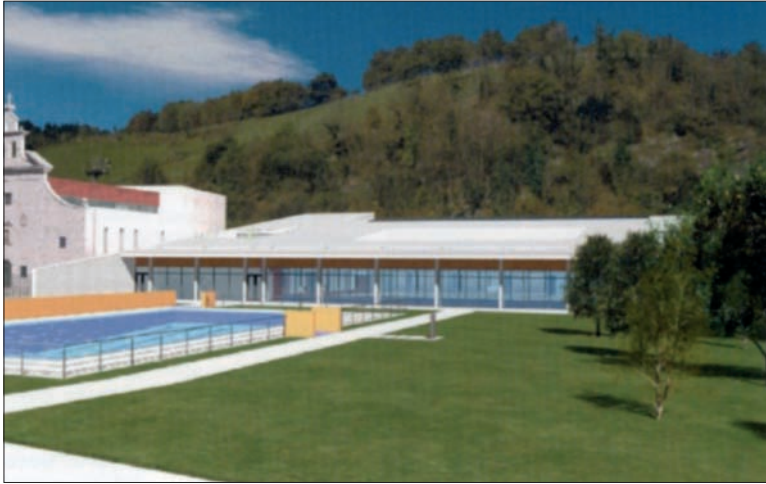
Las piscinas de verano podrán utilizarse ya esta temporada.

PISCINA CUBIERTA.- Con un presupuesto cercano a los cuatro millones de euros, el proyecto de piscina cubierta estará terminado para final de octubre.