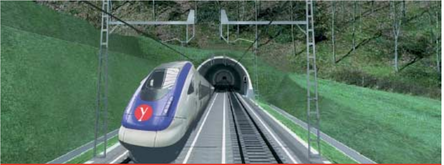
Trenbide sare berri gehiena tuneletatik ibiliko da

La nueva red ferroviaria de Euskadi, más conocida como "Y vasca", es algo más que un proyecto de infraestructura. Es, sin duda, una pieza clave para fortalecer nuestro desarrollo social y económico, para impulsar nuestras relaciones con el resto de Europa y, sobre todo, para construir un país moderno y avanzado.