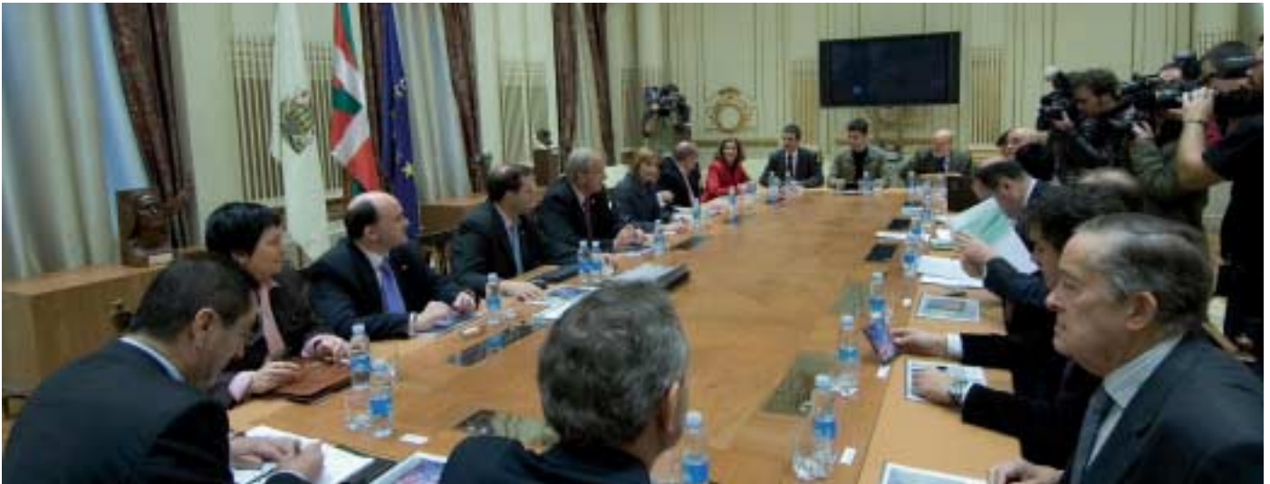
Reunión de los representantes de la sociedad Jaizkibia