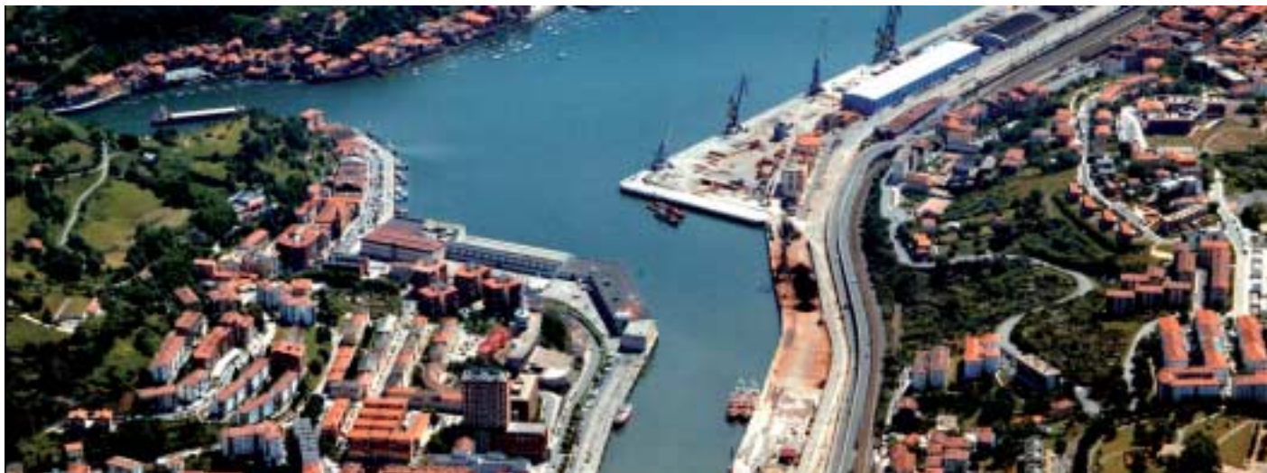
Badiaren etorkizunerako irudia

La nueva sociedad, integrada por representantes del Gobierno Vasco, la Diputación Foral de Gipuzkoa, los ayuntamientos del Jaizkibel y el Gobierno de Madrid, ha decidido iniciar los trámites para la construcción del puerto exterior, que permitirá la reordenación de la dársena actual. Jaizkibia nace con el claro objetivo de regenerar la bahía en una década.