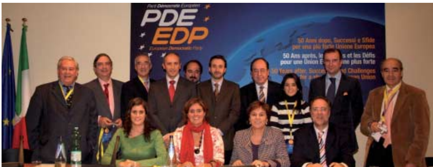
Miembros de la delegación de EAJ-PNV al término del Congreso

instituciones europeas, como si cuanto se decidiera en Europa no afectara a la realidad cotidiana de sus ciudadanos, cuando la realidad es precisamente la contraria.