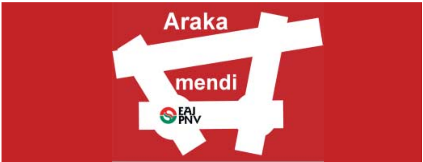
Logotipo del proyecto Arakamendi

En Araka se generarán nuevos espacios para la ciudadanía y el desarrollo económico territorial. Su emplazamiento es inmejorable, limitado por cuatro vías principales, junto al aeropuerto y al Parque Tecnológico de Miñano. El proyecto contempla la descontaminación del terreno y su recuperación paisajística para evitar cualquier perjuicio a los y las vecinas de localidades cercanas.