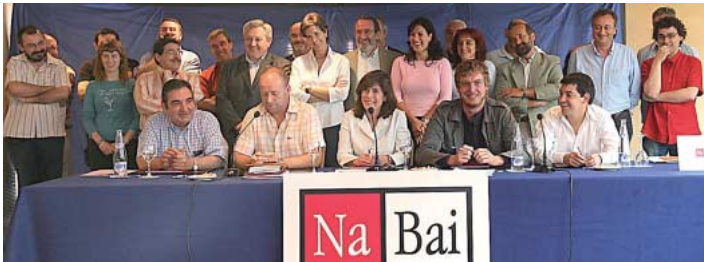
2007ko Foru eta Udal hauteskundeetarako hitzarmenaren aurkezpena

Nafarroa Bai, la coalición formada por Aralar, EA, EAJ-PNV, Batzarre e independientes, concurrirá a las elecciones de mayo con un objetivo muy claro: desalojar a UPN-CDN del poder. El cambio de Gobierno es prioritario y Nafarroa Bai, respaldada por quienes creen que otra Navarra es posible, puede convertirse en la segunda fuerza de la Comunidad Foral.