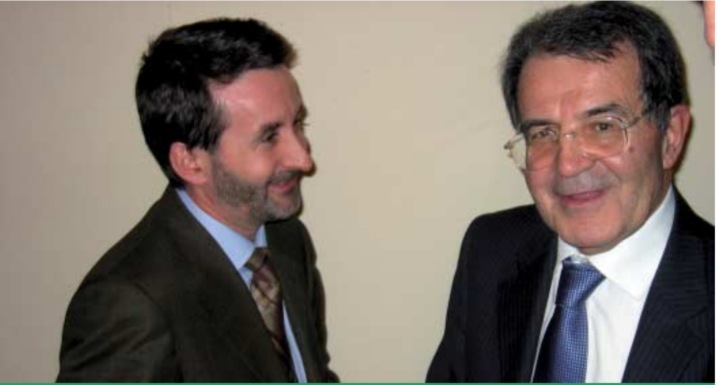
Josu Jon Imaz eta Romano Prodi, elkarrekin Erroman

"Europa necesita de nuevos líderes carismáticos que repiensen la Unión, renueven la ilusión y acerquen el ideal europeo al conjunto de los ciudadanos". Este es una de las claves suscitadas en Roma, durante el debate celebrado al término del II Congreso del Partido Demócrata Europeo, con la participación de EAJ-PNV.