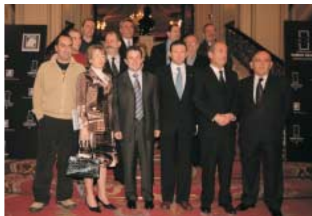
Sabino Arana 2004 sarien gala