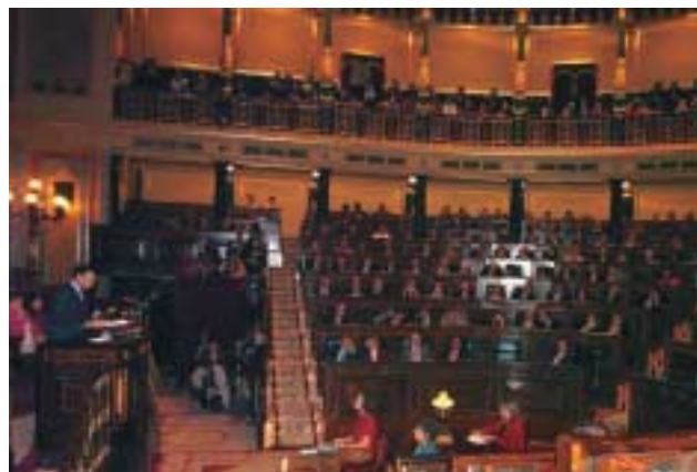
Ibarretxe en el Congreso

El Lehendakari Ibarretxe, acudió al Congreso de los Diputados el pasado 1 de febrero, para defender la tramitación de la Propuesta de Nuevo Estatuto Político de Euskadi, aprobada por mayoría absoluta en el Parlamento vasco el 30 de diciembre. Fue una jornada dura, en la que se lanzaron duros ataques por parte de la derecha española a Ibarretxe. Zapatero, no fue tan beligerante pero no aportó casi nada en sus intervenciones. Al final, la impresión que se llevó la mayoría de la sociedad es que Ibarretxe había perdido la votación pero había ganado el debate.