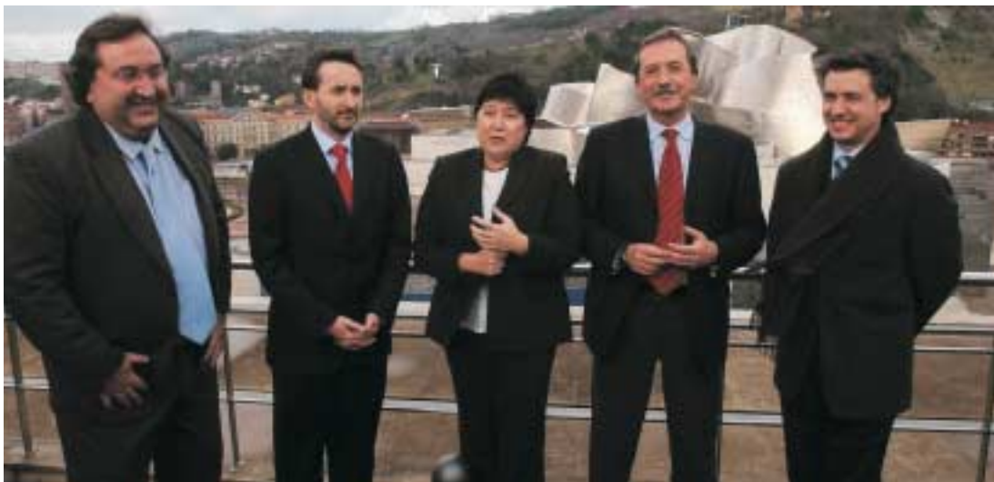
Dirigentes del Foro Económico con Josu Jon Imaz e Iñigo Urkullu