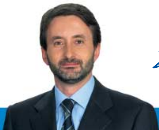
Josu Jon Imaz EBBren Presidentea / Presidente del EBB