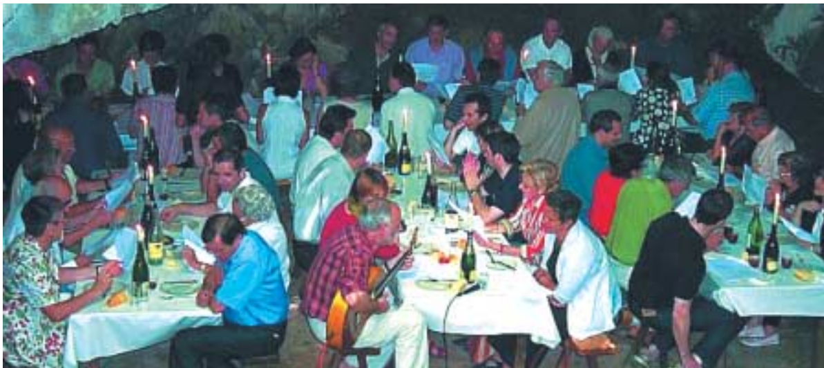
Lema aldizkariaren jaia

Mis cela n'est pas suffisant pour se singulariser, ce mouvement n'étant pas identifié à une formation politique, mais à un large courant euskalzale et abertzale.