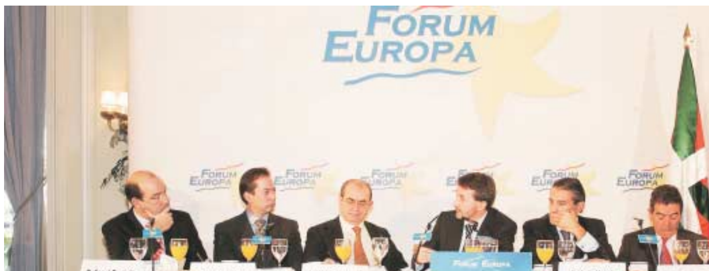
EBBren presidentea Forum Europa-n

Estatutu Berriak esaten du Itun Politiko berria behar dugula estatuarekin gure autogobernuaren markoa gaur egungo euskal gizartearen gehiengoaren asmoei egokitzeko. Horretarako Gernikako Estatuak ezarritako bitartekoak eta aukerak erabiltzen ditu.