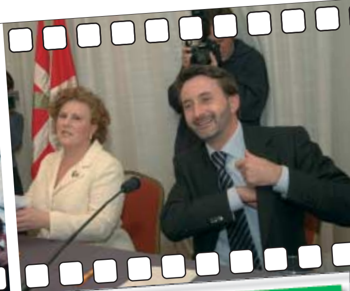
Firma del Acuerdo de Coalición con Eusko Alkartasuna. Para nuestro partido más que un pacto puntual es un acuerdo estratégico y de futuro para Euskadi y para el Nacionalismo vasco