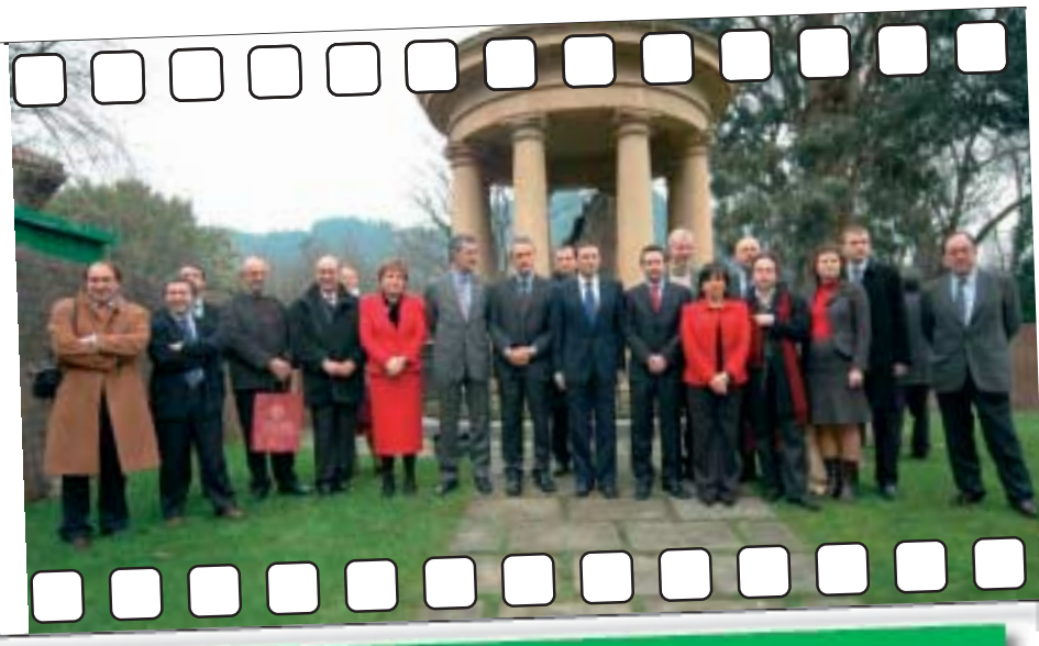
Congreso del Partido Demócrata Europeo en Bilbao. EAJ/PNV ha sido uno de los grupos fundadores de este nuevo partido europeo que cuenta entre sus filas con personalidades como Romano Prodi o Francesco Rutelli