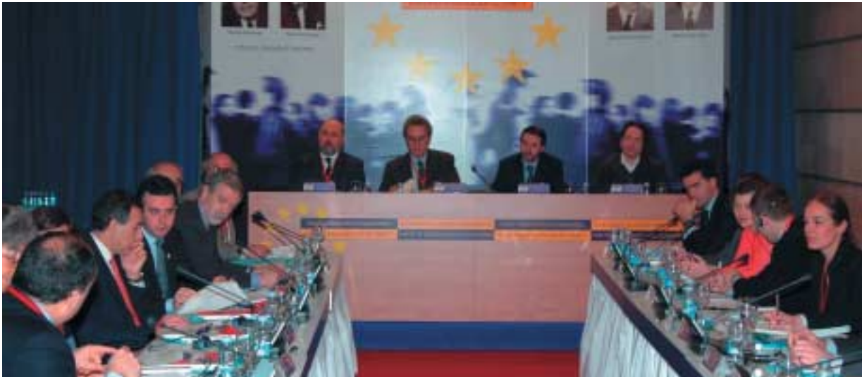
Europako Alderdi Demokrataren bilera Sabin Etxean

La primera reunión del Consejo Político del Partido Demócrata Europeo (PDE), en el que está integrado EAJ-PNV, se ha celebrado en Bilbao los días 5 y 6 de febrero. Josu Jon Imaz, ha manifestado ante los participantes en este foro que “la apuesta del Partido Nacionalista Vasco es que haya un Sí masivo en Euskadi a favor del Tratado Constitucional Europeo”.