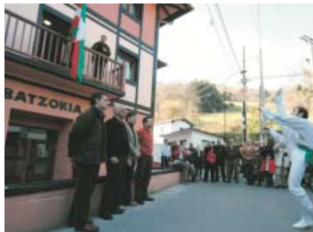
Inauguración del nuevo batzoki de Zierbena

Para la inauguración se contó con la presencia del presidente del EBB, Josu Jon Imaz, y del presidente del BBB, Iñigo Urkullu, que disertaron sobre aspectos de la actualidad política en un acto que reunió a varios cientos de alderdikides.