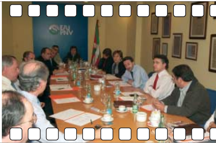
Euzkadi Buru Batzar. Reunión del EBB con los portavoces parlamentarios de EAJ/PNV en Madrid y en Gasteiz.