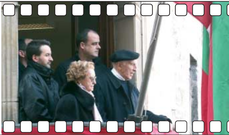
Acto de conmemoración del centenario del Batzoki de Bergara