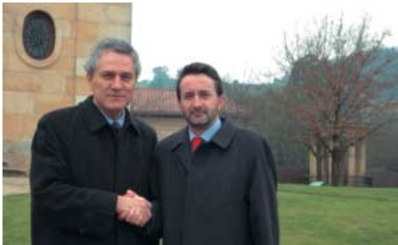
Francesco Rutelli y Josu Jon Imaz en la Casa de Juntas de Gernika

que “el PDE respalda al postura del PNV ante el próximo referéndum del Tratado Constitucional Europeo”.