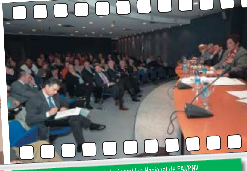
Intervención de Josu Jon Imaz ante la Asamblea Nacional de EAJ/PNV.