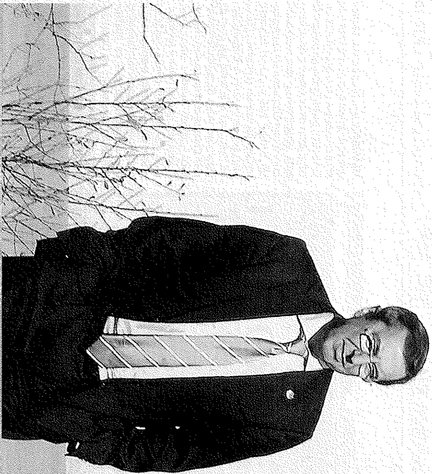
El diputado general de Bizkaia, José Luis Bilbao, asegura que defenderá con uñas y dientes los intereses de Bizkaia, y por ellos es capaz de alzar la voz.