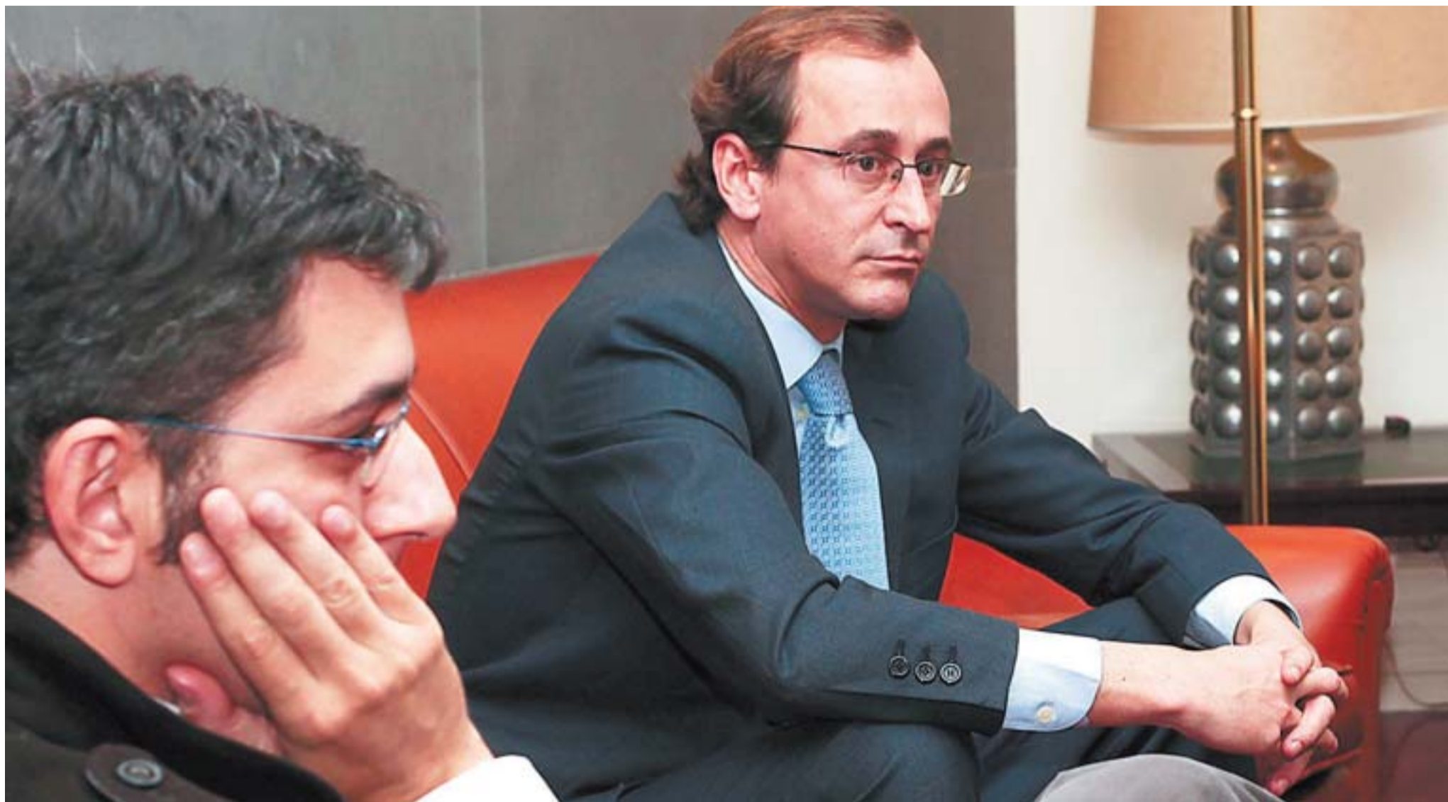
Eduardo Madina, Alfonso Alonso y Uxue Barkos escuchan los argumentos de Josu Erkoreka en un momento de la conversación celebrada en la sala Acuña del Congreso de los

tradas e incluso un año, pero también hay una flota atunera francesa que no ha tenido ni un solo secuestro. Las opiniones que he podido recabar entre algunos militares me confirman que muchos están deseando participar en la misión de protección para demostrar que son útiles.