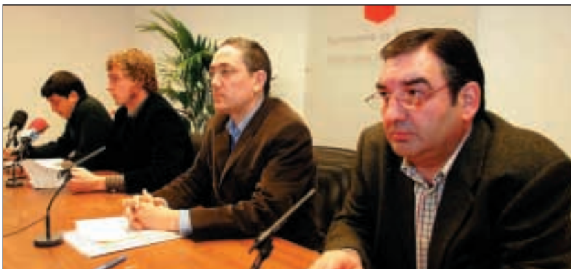
De izquierda a derecha, los representantes de Batzarre, EA, Aralar y EAJ-PNV el día que anunciaron en el Parlamento su propuesta conjunta

Las formaciones que integran Nafarroa Bai han consensuado un documento que será presentado en el Parlamento y en el que plantean medidas y actuaciones para una nueva política lingüística en Navarra