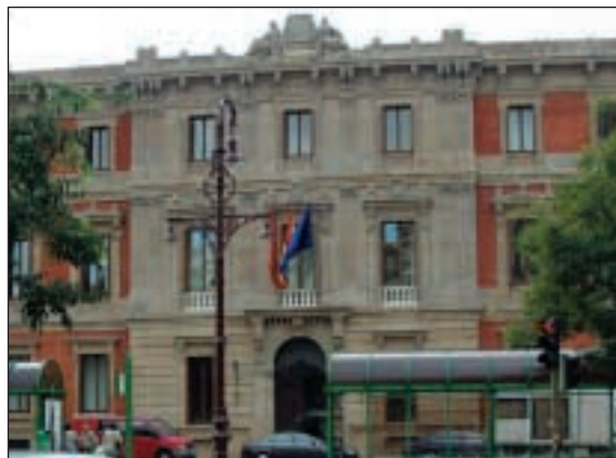
Parlamento de Navarra

“Estatuko foro politiko guztietan gaur eguneko Estatuaren gaineko eztabaida egiten ari diren une bonetan, Nafarroan UPN, CDN eta PSN alderdiek isilik jarraitzen dute gaia beren ardurakoa izango ez bailitzan eta, ondorioz, Nafarroaren ardurakoa ere ez”