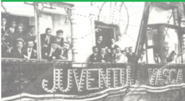
Abarrotados balcones en la sede de Bidebarrieta (31/07/1909)