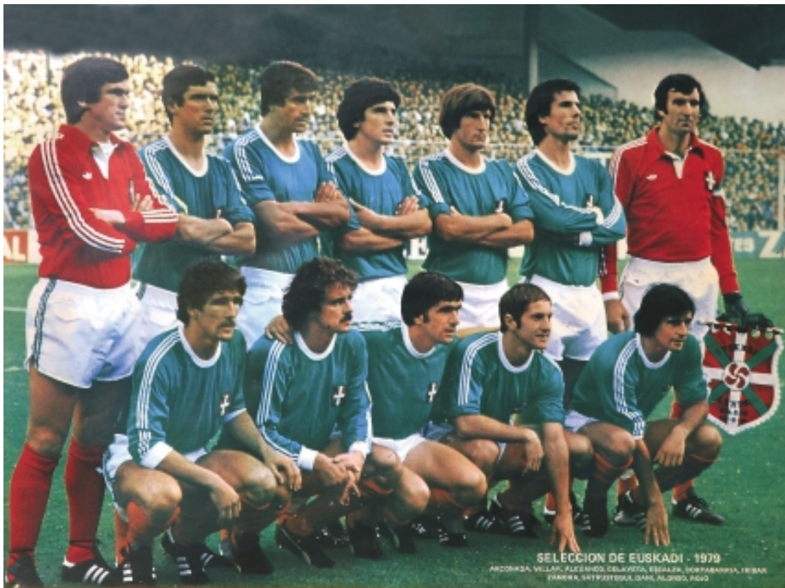
1979ko Euskadiko selekzioa San Mamesen