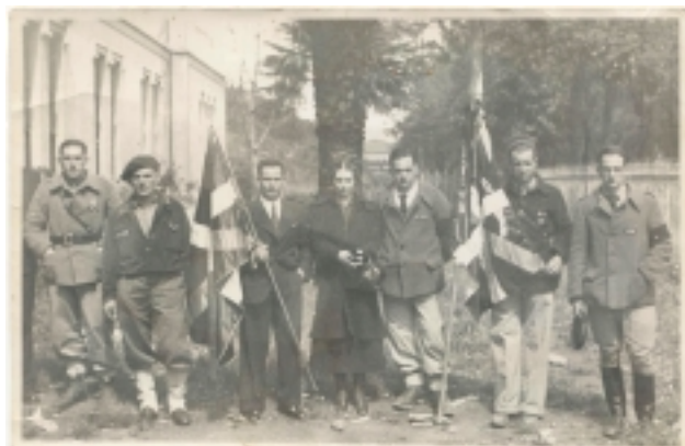
Bendición de la Ikurriña del Batallón Saseta