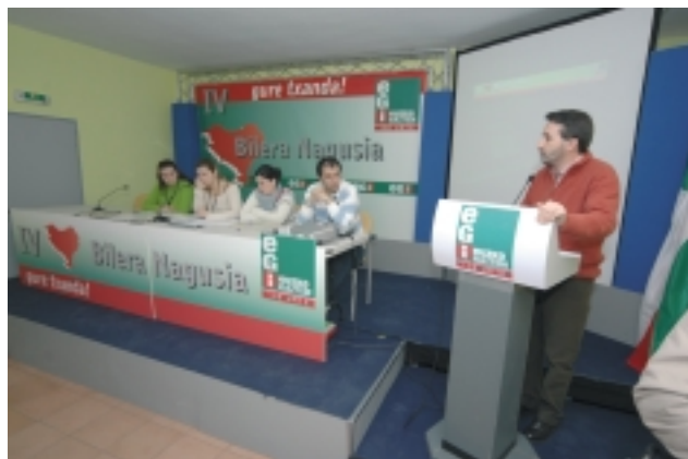
Imaz EGiren IV Bilera Nagusian

Abenduaren 11 eta 12an, Euzko Gaztedi-EGI, bere IV. Bilera Nagusia ospatu du Zarautz-eko Monte Albertia aterpetxean. Gazte erakunde hamaika ponentzia onartu ditu datorren lau urteetan garatzeko. Ponentziak etxebizitza, ingurumena, boluntarioritza, migrazioa, drogomenpekotasuna, asilo politikoa, globalizazioa, euskera, kultura eta ponentzia politikoa izan ziren. Larunbateko sarrera ekitaldian Euzkadi Buru Batzarreko presidentea dan Josu Jon Imaz, hitz batzuk zuzendu zituen bildutako EGIkideei. Ehungarren urteurrena ospatzen duen erakundeak, bere ospakizunen gorengo ekitaldia lortzea helburu izan du Bilera Nagusi honek.