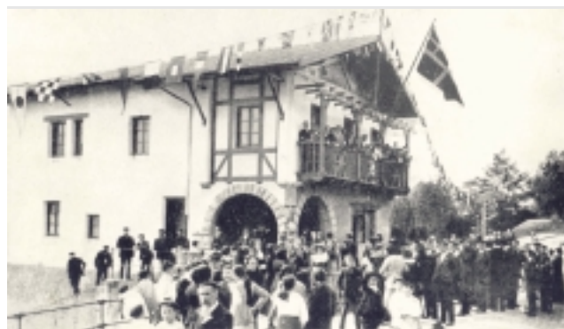
Batzoki de Deusto en 1912