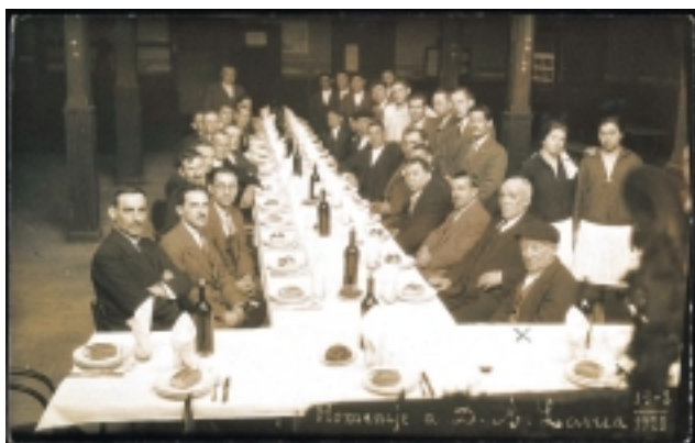
Batzokia Bergarako Batzokian (1928/03/19)

Salvo en algún caso aislado, ninguna de las inauguraciones de estos Batzokis se vio libre de polémica. "La Voz de Guipúzcoa" denunció que en la inauguración de la Sociedad de Euzkadi de Rentería se produjeron gritos subversivos y varios detenidos. En Bergara, tras demorarse el registro en el Gobierno Civil del reglamento del Bergarako Euzko Batzokija, el ayuntamiento rechazó la cesión del salón municipal para los actos inaugurales.