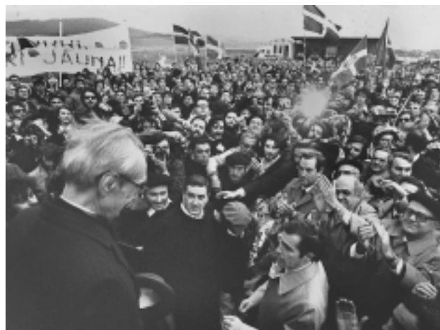
Recibimiento de Jesús María de Leizaola en Sondika

El aeropuerto de Sondika fue un hervidero de militantes y simpatizantes nacionalistas que querían dar el “ongi etorri” al que fue el baluarte de la causa vasca en el exilio. Leizaola, emocionado pero a la vez contento de volver a pisar tierra vasca, agradeció el recibimiento y manifestó que su trabajo en la capital francesa tendría su continuidad en Euskadi.