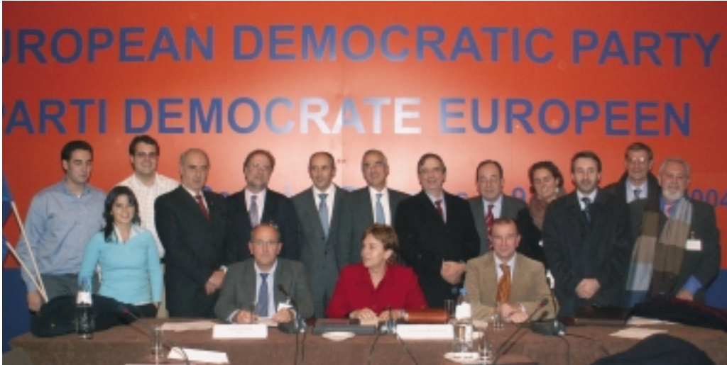
Delegaciones del PNV y EGI acudieron a la reunión del Partido Demócrata Europeo

La primera reunión ejecutiva del Partido Demócrata Europeo tendrá lugar a primeros del mes de febrero en Bilbao, en vísperas del referéndum del Tratado Constitucional Europeo. El acuerdo fue adoptado durante el congreso constituyente, el 9 de diciembre en Bruselas. Según el presidente del partido italiano La Margherita, Francesco Rutelli, “hemos optado por el País Vasco en reconocimiento al empeño europeísta de sus líderes y para apoyar el compromiso demostrado por sus representantes”.