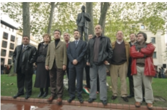
Miembros del EBB en el homenaje a Arana el 28 de noviembre