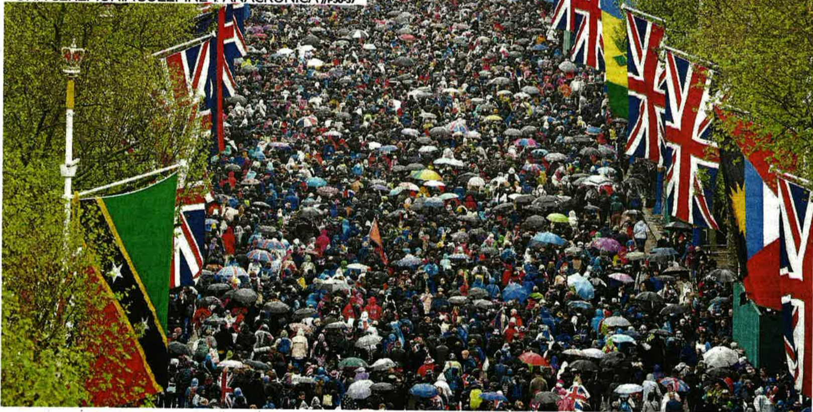
Decenas de miles de personas abarrotaron ayer el centro de Londres para asistir a la coronación de Carlos y Camila como reyes del Reino Unido.

CARLOS III Y CAMILA SON CORONADOS REYES EN UNA CEREMONIA SOLEMNE Y ANACRÓNICA //P36-37