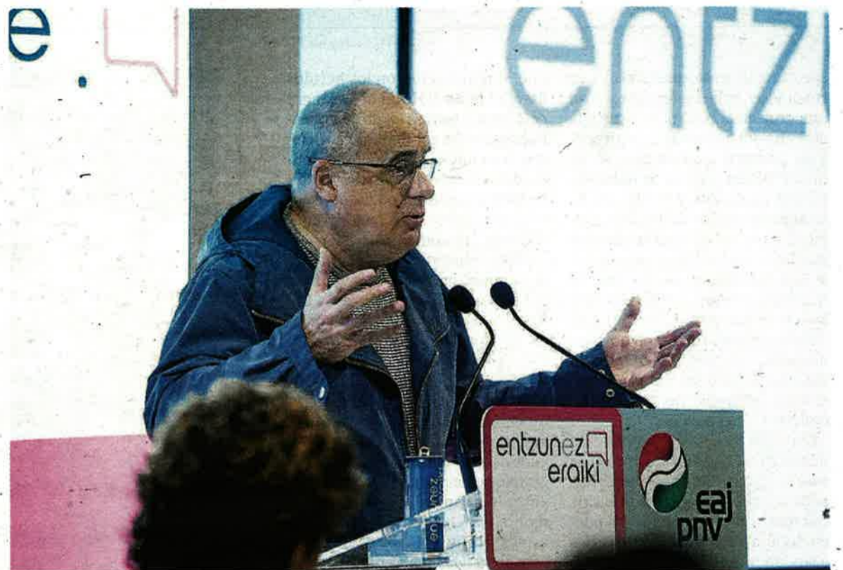
Egibar, durante un acto del proceso de escucha del PNV del año pasado.

Vázquez, que forma parte de la lista municipal del PP en Basauri, mostró su descontento con las políticas en materia de seguridad en Euskadi y propuso "condecorar a todos los policías que han prestado servicio en esta tierra". -E. E.