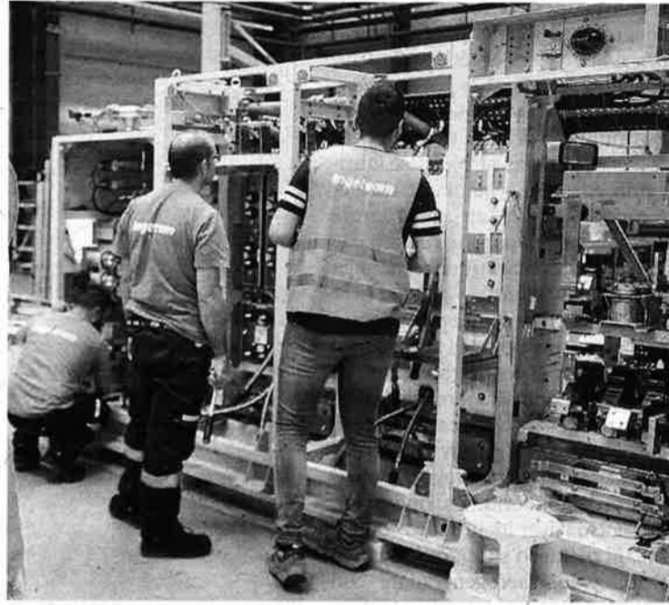
Trabajadores de Ingeteam.

Ingeteam subrayó que, entre los distintos tipos de cargadores de vehículo eléctrico que Ingeteam fabricará, se encuentra el cargador ultrarrápido RAPID 180 kW, que fue premiado con el Red Dot Design Award, de reconocimiento mundial y otorgado por la orga-