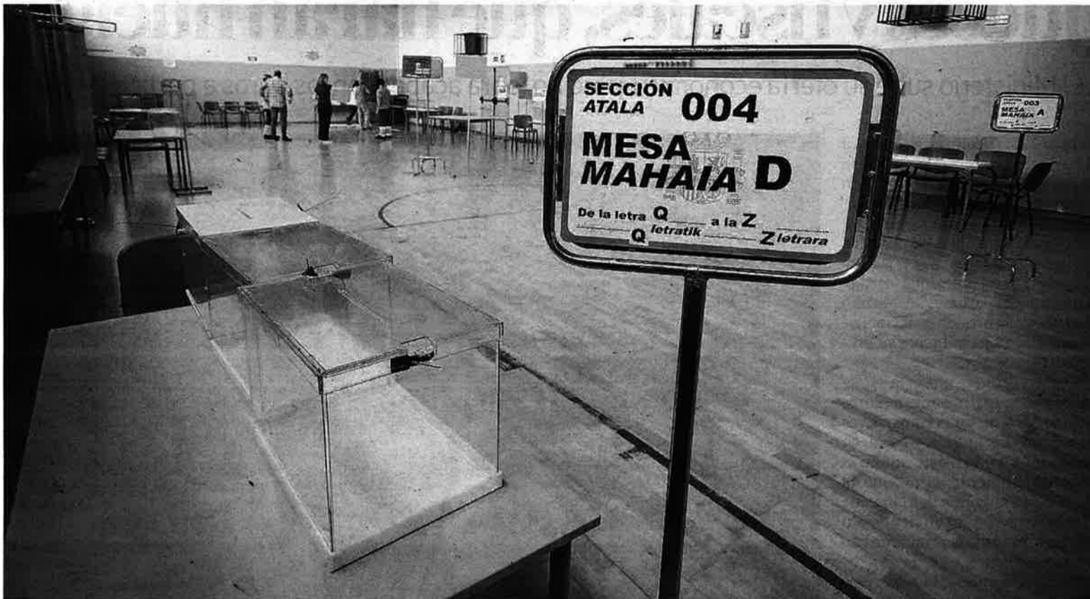
Preparativos en un colegio para la jornada de las elecciones autonómicas y municipales de 2019.