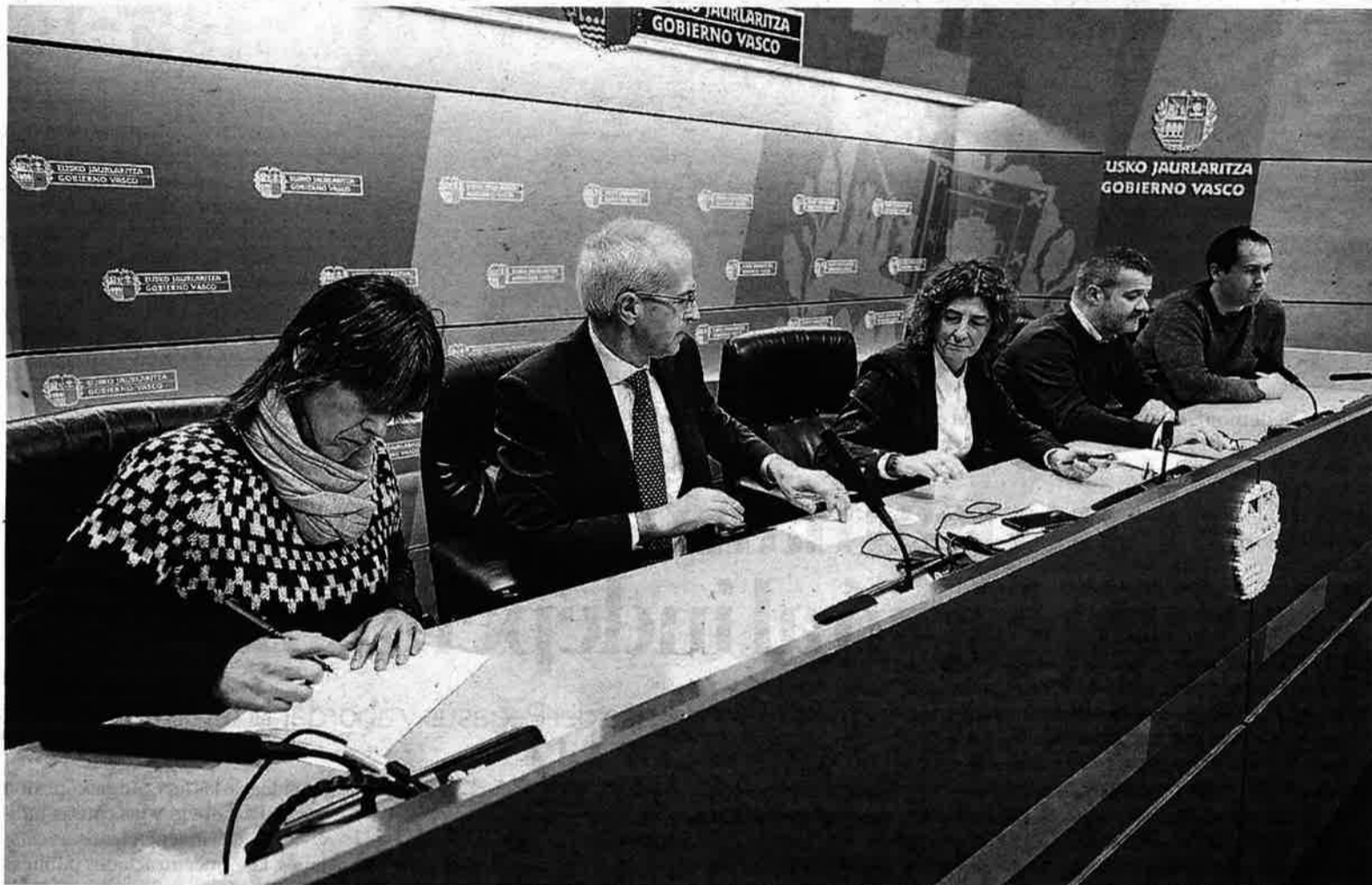
Firma del convenio del Metal de Bizkaia en febrero de este año.

Por ese motivo, más allá de los números planteados para este año, los sindicatos harán hincapié en