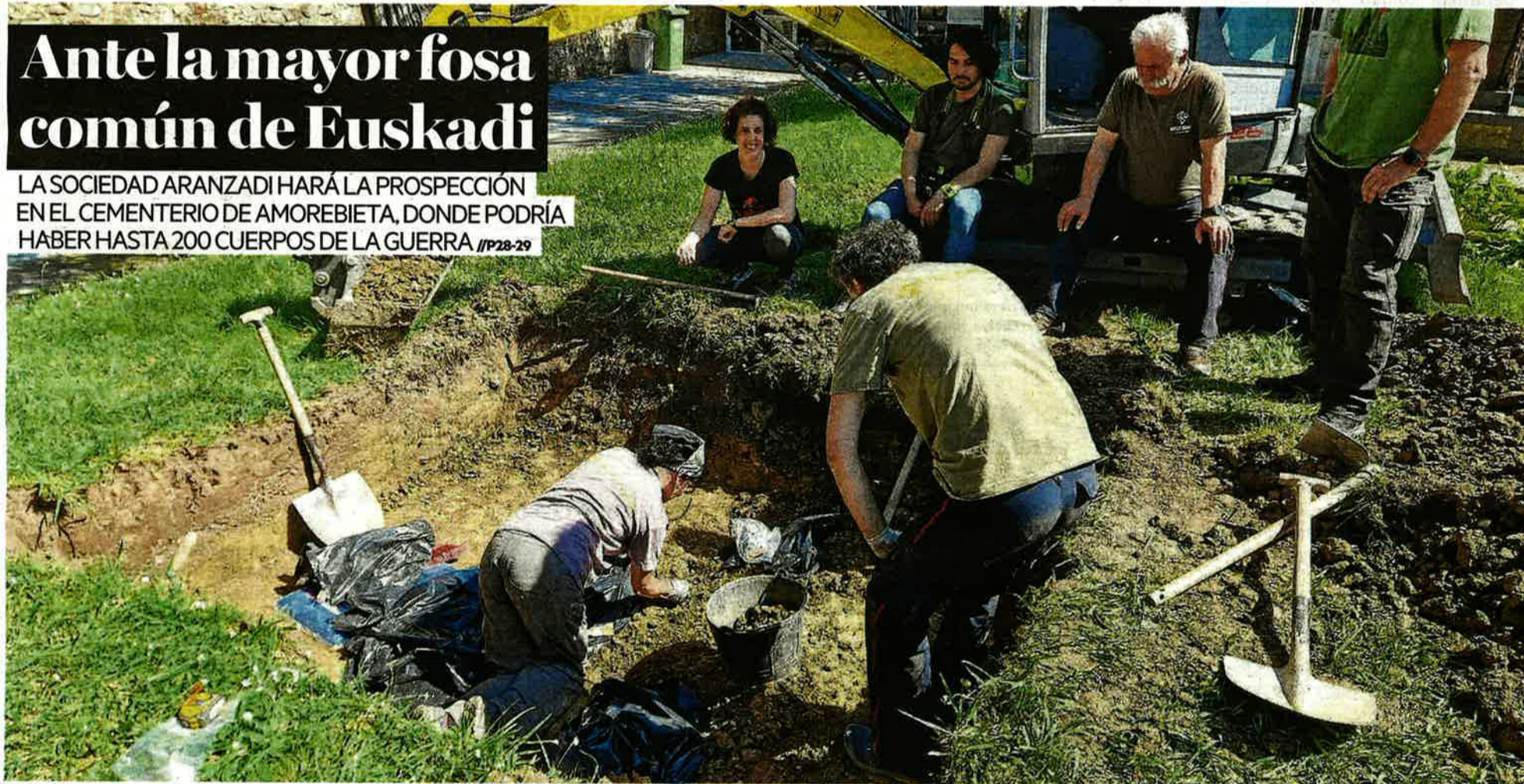
Expertos de la Sociedad de Ciencias Aranzadi, durante la intervención en el cementerio de Amorebieta-Etxano.

LA SOCIEDAD ARANZADI HARÁ LA PROSPECCIÓN EN EL CEMENTERIO DE AMOREBIETA, DONDE PODRÍA HABER HASTA 200 CUERPOS DE LA GUERRA //P28-29