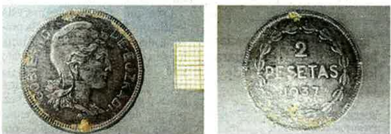
Restos óseos y una moneda de dos pesetas hallados en la fosa.