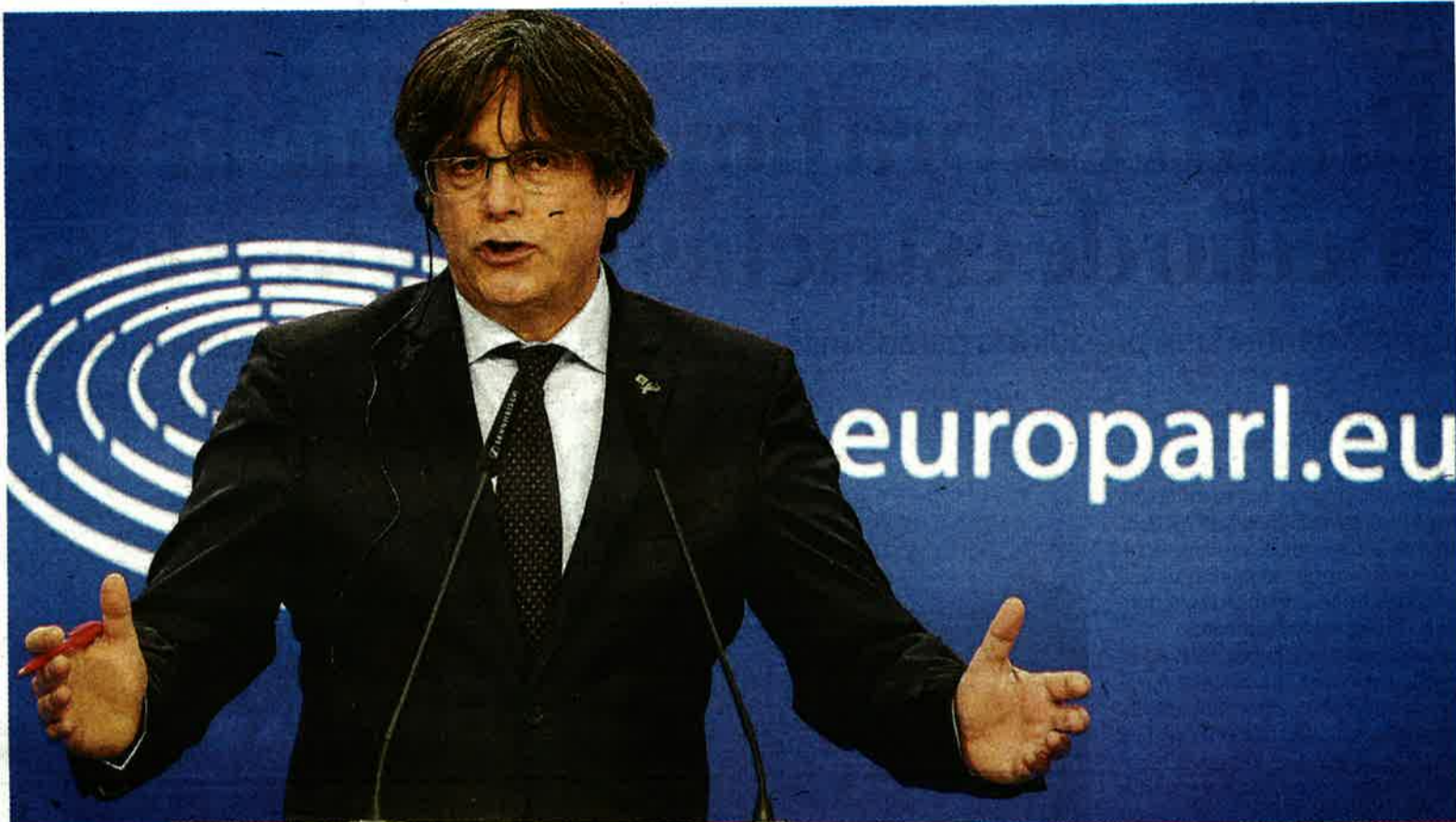
Carles Puigdemont, durante una rueda de prensa en el Parlamento Europeo.

Como reflexión global, no ceñida estrictamente al caso del Estado español, Reynders dijo que el diálogo, “desafortunadamente, no siempre trae resultados, y por consiguiente, es necesario, además de diálogo, acciones decisivas”. — E. P.