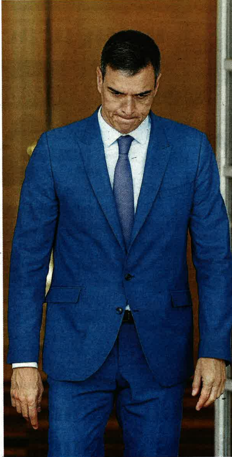
Pedro Sánchez, ayer en La Moncloa.

PILAR ALEGRÍA Ministra de Educación y pvoz. del PSOE