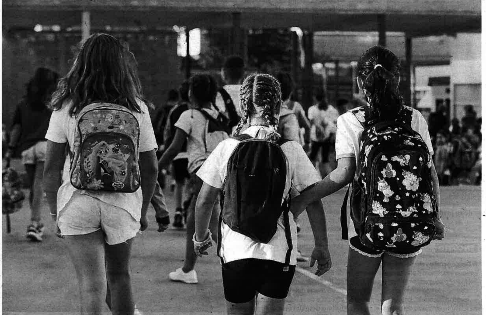
Un grupo de estudiantes se encaminan hacia el colegio.

Con los datos facilitados en la mano, el hecho es que la resolución del proceso de matrícula confirma que las medidas correctoras no han colisionado con la libertad de elección de las