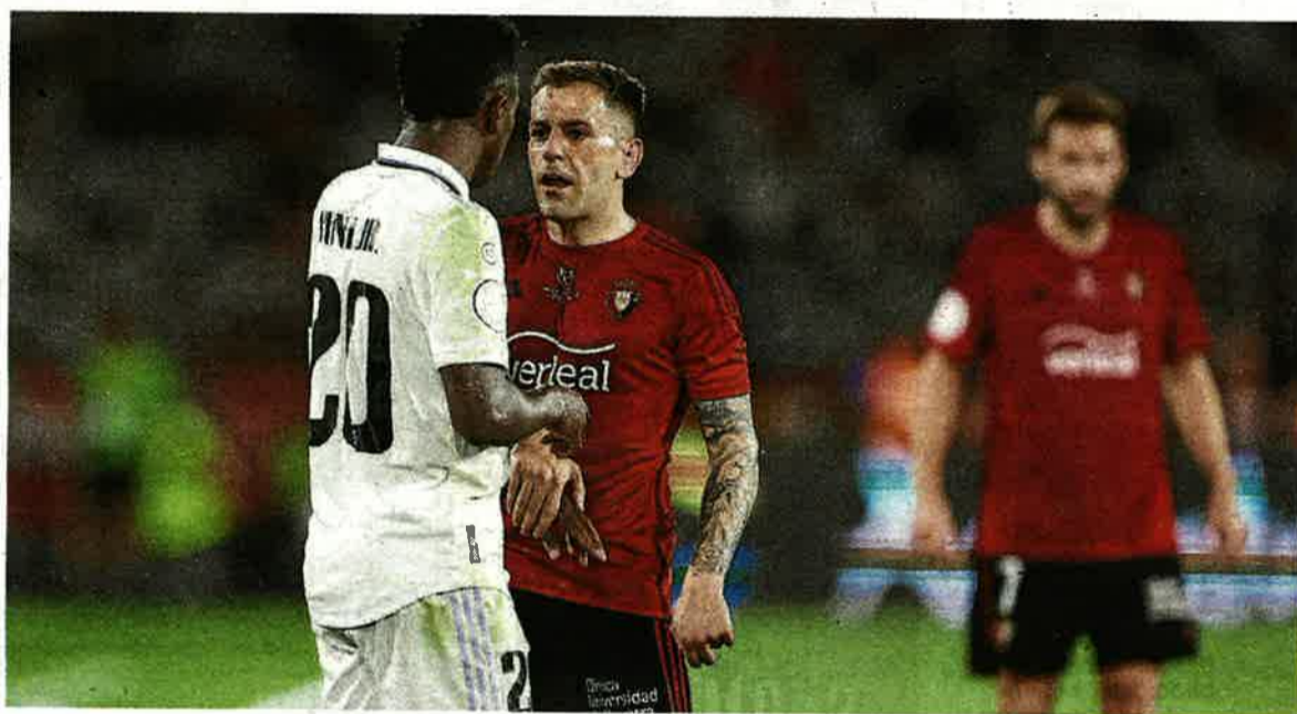
Vinicius, un provocador que solo acaba los partidos porque los árbitros saben quién manda.

ESAS LÁGRIMAS - Viendo la final de Copa del pasado sábado, recordé por qué un día me gustó mucho el fútbol y por qué hoy ocupa un lugar casi residual entre mis aficiones. Empezando por lo primero, por lo positivo, creo que el resumen gráfico de mi antigua pasión está en las lágrimas de Jagoba Arrasate tras el pitido final. No lloraba por él, estoy seguro, sino por las decenas de miles de personas que se habían atrevido a compartir un sueño que desafiaba no solo la lógica sino los usos y costumbres del llamado deporte rey en el Estado español, donde todos los clubs menos dos tienen asignado el papel de comparsas. Cantaba Gardel que contra el destino nadie la talla. Lo que vimos el otro día es la adaptación de la frase al negocio balompédico. Casi no hay forma de que una escuadra de las señaladas para hacer buñito le pinte la cara, llegado el momento de la verdad, al equipo que desde antes de saltar al césped sabía que el título -que, para colmo, consideran menor- engrosaría su palmarés.