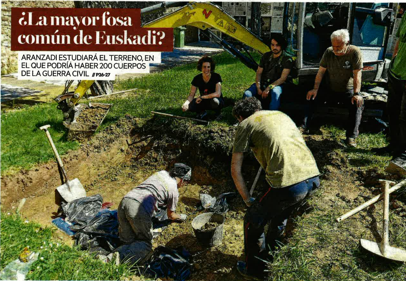
Expertos de la Sociedad de Ciencias Aranzadi, durante la intervención en el cementerio de Amorebieta-Etxano.

ARANZADI ESTUDIARÁ EL TERRENO, EN EL QUE PODRÍA HABER 200 CUERPOS DE LA GUERRA CIVIL // P26-27