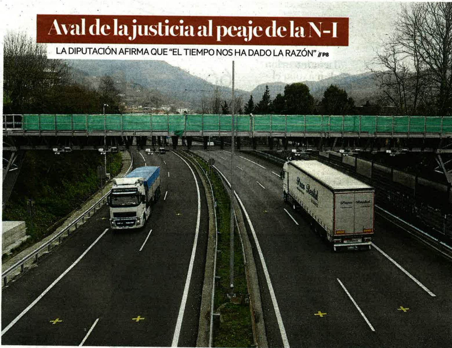
En la imagen, dos camiones pasando por el arco de peaje de la N-I, que ha recibido el aval judicial del TSJPV.

LA DIPUTACIÓN AFIRMA QUE “EL TIEMPO NOS HA DADO LA RAZÓN” // P8