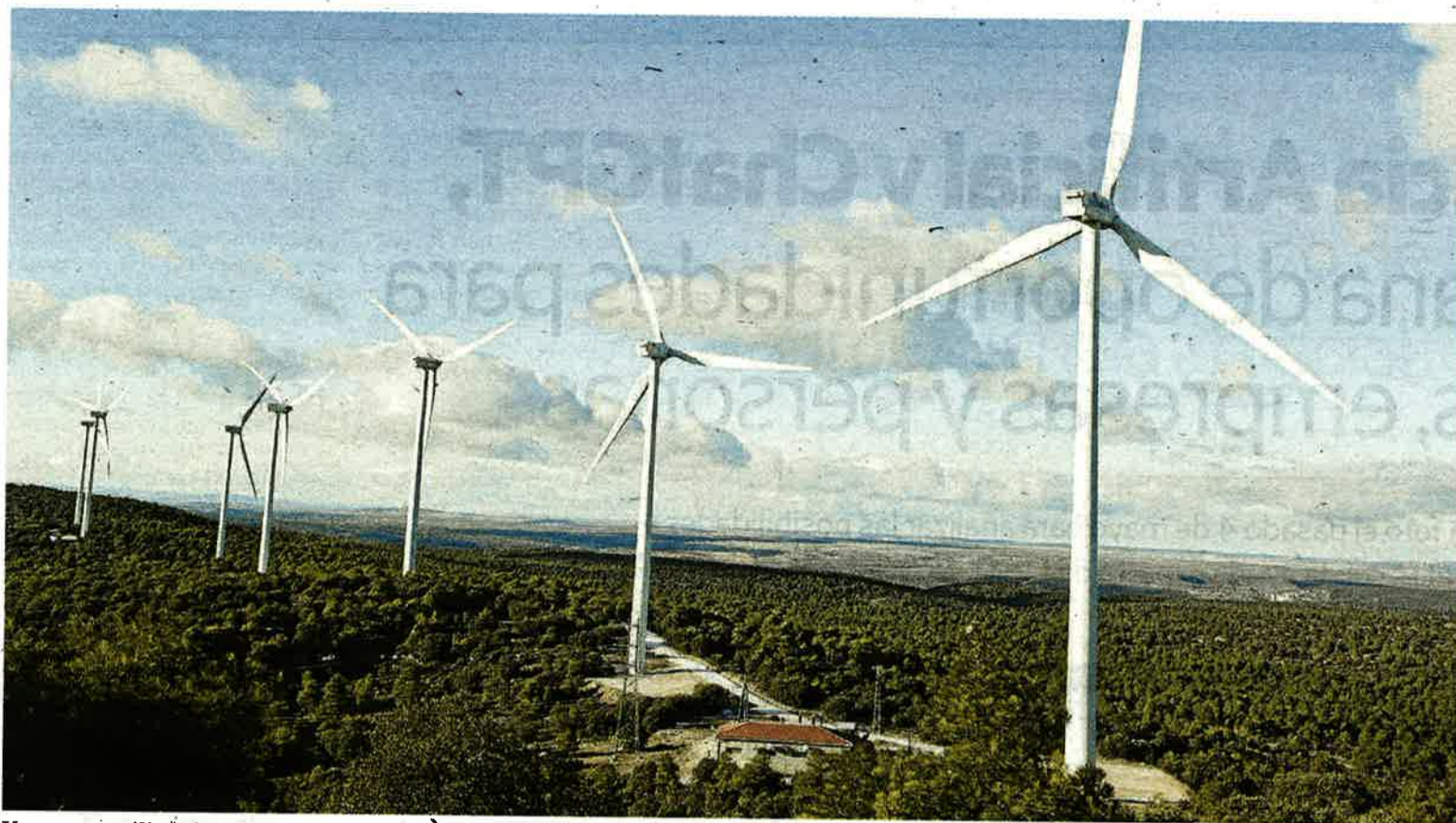
Un parque eólico ajeno a la información.