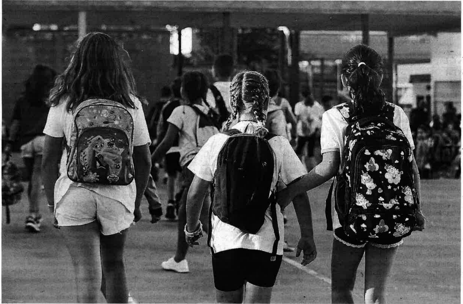
Un grupo de estudiantes se encaminan hacia el colegio.

Con los datos facilitados en la mano, el hecho es que la resolución del proceso de matrícula confirma que las medidas correctoras no han colisionado con la libertad de elección de las