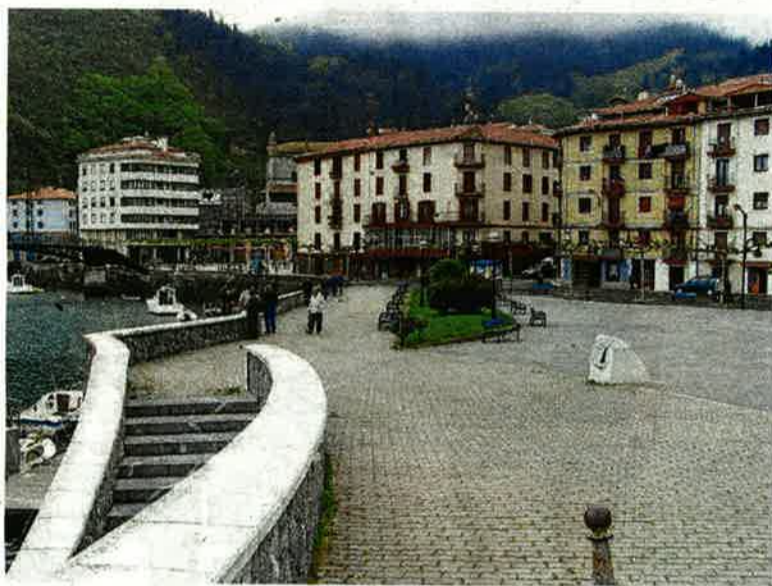
Zona de Itsasaurre, céntrico emplazamiento de Ondarroa.

"Nos anunciará a través de Udabarriak de las bondades de un presupuesto en el que hablarán de proyectos que no ejecutará el actual equipo de Gobierno, sino el que salga de las urnas cuatro días después". No obstante, los jeltzales han ahondado en que "no es la primera vez que lo hacen; otro proyecto, como el de la urbanización de Kamiñazpi, fue anunciado también en vísperas de las elecciones de 2019 y aún no se ha llevado a cabo". Aseguran incluso no contar con la información necesaria por parte de EH Bildu para poder trabajar previamente sobre el proyecto de las cuentas