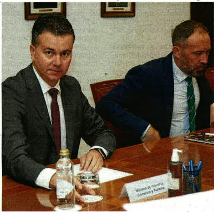
El ministro, ayer en la capital alavesa.