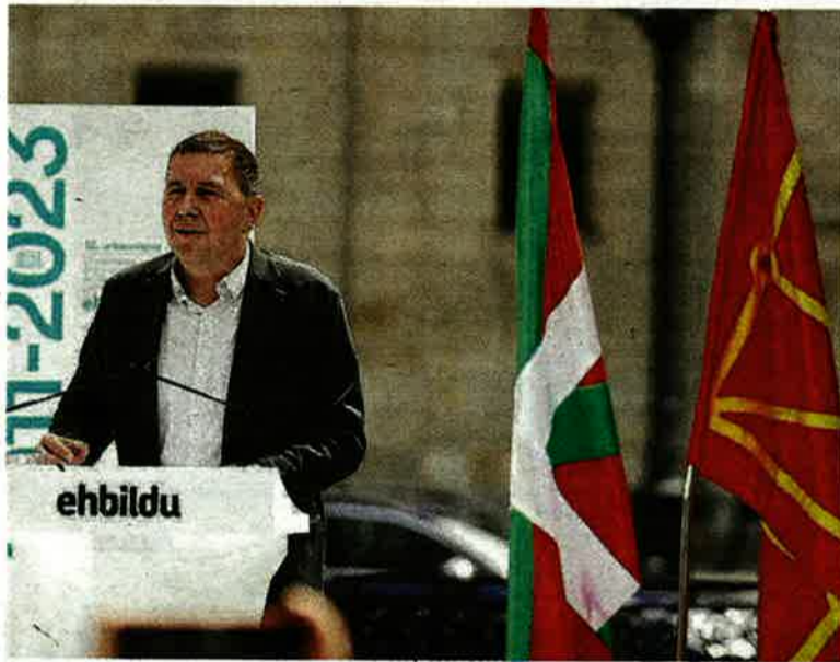
El coordinador general de EH Bildu, Arnaldo Otegi, en un acto.

Tampoco EH Bildu parece que vaya a cambiar su posición respecto a 2019, cuando facilitó la investidura de Chivite con una abstención pese a que los socialistas rechaza-