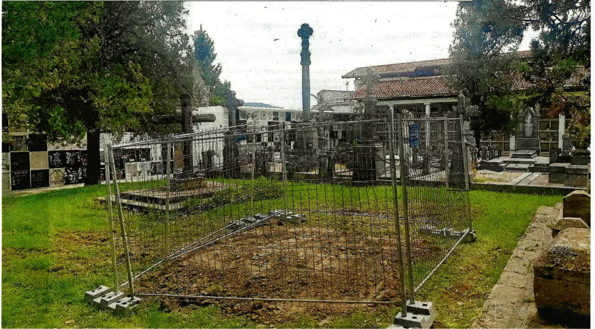
Área delimitada en el cementerio de Amorebieta-Etxano donde trabaja el grupo de expertos de la Sociedad de Ciencias Aranzadi.