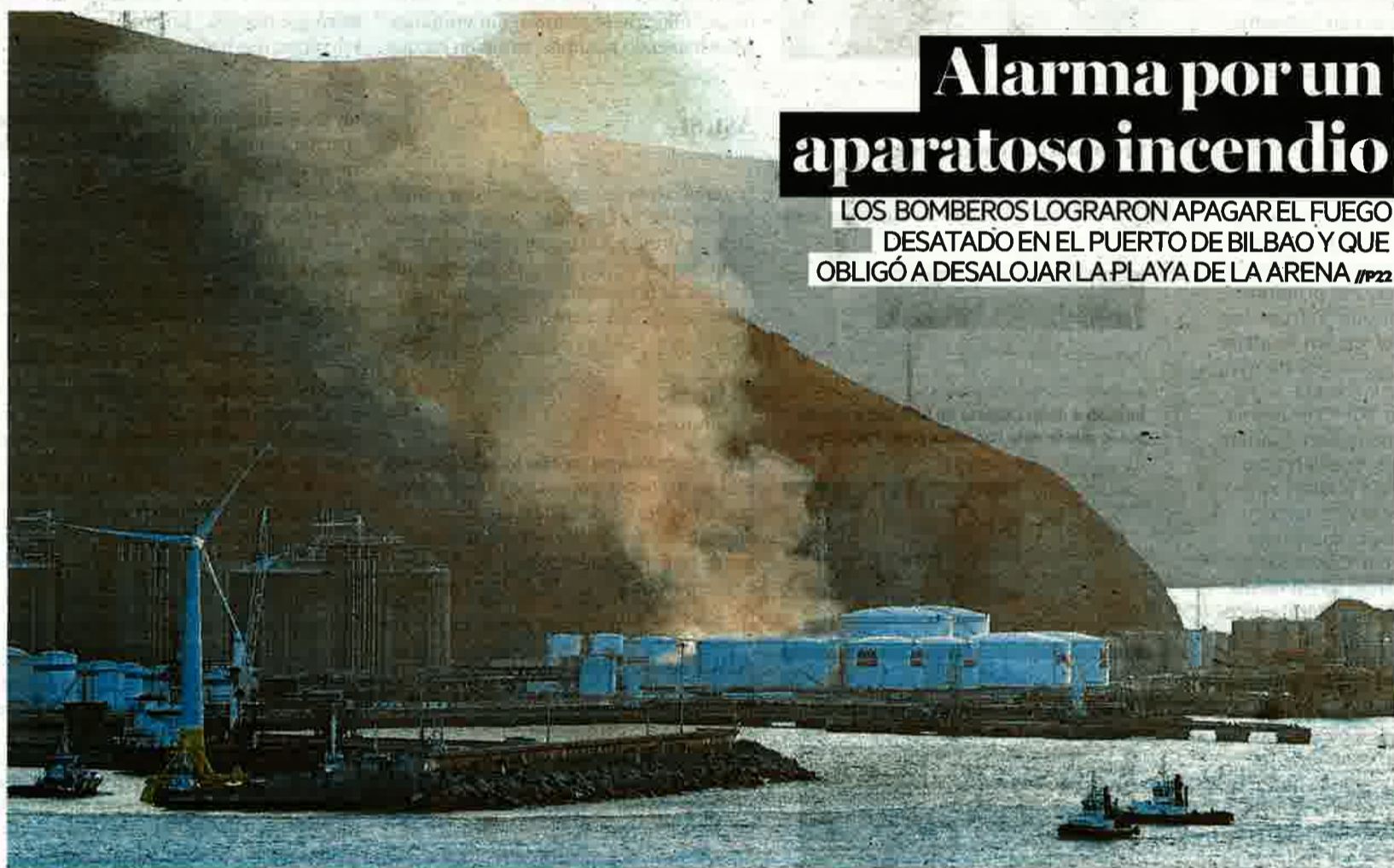
El incendio que se desató en un depósito de combustible de la empresa Esergui del Puerto de Bilbao generó una espesa columna de humo.

LOS BOMBEROS LOGRARON APAGAR EL FUEGO DESATADO EN EL PUERTO DE BILBAO Y QUE OBLIGÓ A DESALOJAR LA PLAYA DE LA ARENA //P22